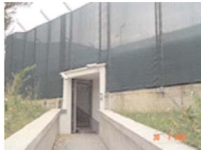
Ulaz u Pritvorsku jedinicu

Svaka ćelija opremljena je mokrim čvorom, grijanjem, klimatizacijom i TV-om. Osim toga, pritvorenici na raspolaganju imaju sobu za sastanke sa advokatima, prostor za šetnju, teretanu, biblioteku, priručnu ambulantu i sobu za molitve. U posebnoj prostoriji pritvorenici mogu, prema potrebi, tokom cijelog dana primati posjete svoga advokata. Pritvorenici imaju pravo na šetnju na otvorenom u trajanju od dva sata u toku dana, pet i po sati dnevno za zajedničke aktivnosti u biblioteci i teretani, te trideset minuta dnevno za posjete porodice. Ostatak vremena provode u svojim ćelijama. Porodica ima pravo svakodnevno donositi hranu koja odgovara normalnim dnevnim potrebama pritvorenika, a maksimalna težina ne smije prelaziti 5 kg dnevno. U ovoj pritvorskoj jedinici pritvorenici ostaju tokom sudskog procesa.