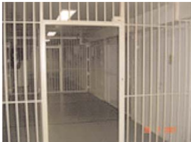
Unutrašnjost Pritvorske jedinice

Pitvorska jedinica ima 21 jednokrevetnu ćeliju, površine od 13 kvadratnih metara. U skoroj budućnosti Pritvorska jedinica će se proširiti, odnosno povećati broj ćelija.