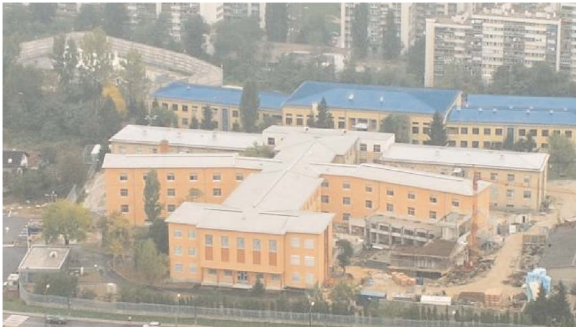
Kompleks zgrada u Sarajevu u kojima su smješteni Sud BiH, Tužilaštvo BiH i Pritvorska jedinica

Pored ovih, predmeti koji su također u nadležnosti Odjela za ratne zločine Suda BiH jesu i oni u kojima se pojavljuju posebno ugroženi svjedoci, kao što su insajderi ili svjedoci koji bi i sami mogli biti uključeni u krivična djela, te ako postoji realna pretpostavka da bi moglo doći do zastrašivanja svjedoka. Također, pred ovim sudom procesuiraju se i oni predmeti za koje se može realno pretpostaviti da bi lokalne vlasti mogle biti zainteresirane da iz bilo kojeg razloga zaštite osumnjičenog za određeni zločin. Dakle, ukoliko predmet ispunjava bilo koji od navedenih kriterija, klasificira se kao “veoma osjetljiv” te se procesuiraju pred Sudom BiH. Predmeti koji ne ispunjavaju ove kriterije označavaju se kao “osjetljivi” i upućuju se na procesuiranje pred kantonalnim/okružnim sudovima.