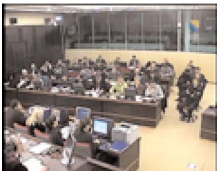
Suđenje pred Sudom BiH

Također, branilac je dužan iznositi samo istinu o činjenicama, ali ima pravo prešutjeti činjenice koje su na štetu optuženog. Prema Zakonu o krivičnom postupku, u glavnom pretresu se pruža prilika suprotstavljenim stranama u postupku (optužba i odbrana) da naizmjenično iznesu svoje navode i kritički se osvrnu na navode suprotne strane, odnosno pobiju ih. Također, sve strane u postupku, uključujući i branioca, imaju pravo direktnog ispitivanja svjedoka ili vještaka, a zatim i unakrsnog ispitivanja.